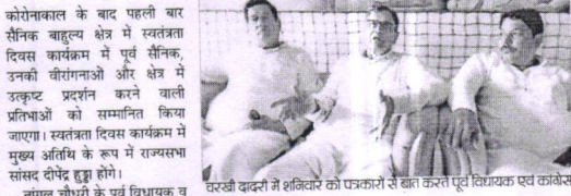
चरखी दादरी, 30 जुलाई (विज)

कोरोनाकाल के बाद पहली बार सैनिक बहलुत्व क्षेत्र में स्वतंत्रता दिवस कार्यक्रम में पूर्व सैनिक, उनकी वीरगंगाओं और क्षेत्र में उत्कृष्ट प्रदर्शन करने वाली प्रतिभाओं को सम्मानित किया जाएगा।