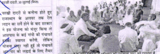
चरखी दादरी, 30 जुलाई (विज)

चरखी दादरी से कनिनी होते हुए राजस्थान के अलवर तक रेल लाइन का सर्वे होने के बाद सरकार ने इस योजना को मंजूर किया तो आसपास के कई गांवों को पंचायतें झुंझी स्वागत करीं, लेकिन योजना मंजूर नहीं हुई तो पंचायतें आर-पार की लड़ाई के लिए तैयार हैं और बड़ा आंदोलन भी कर सकती हैं।